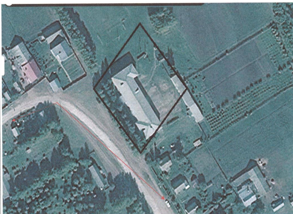
Схема безопасных маршрутов